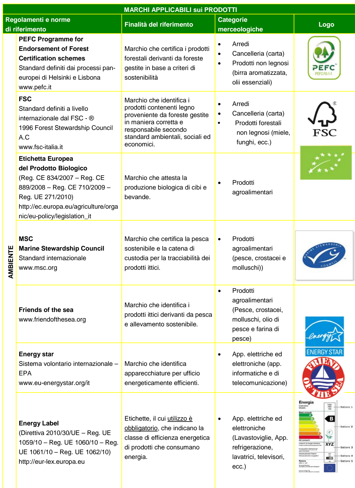
Tabella 4 – I principali marchi di prodotto disponibili per le diverse categorie merceologiche